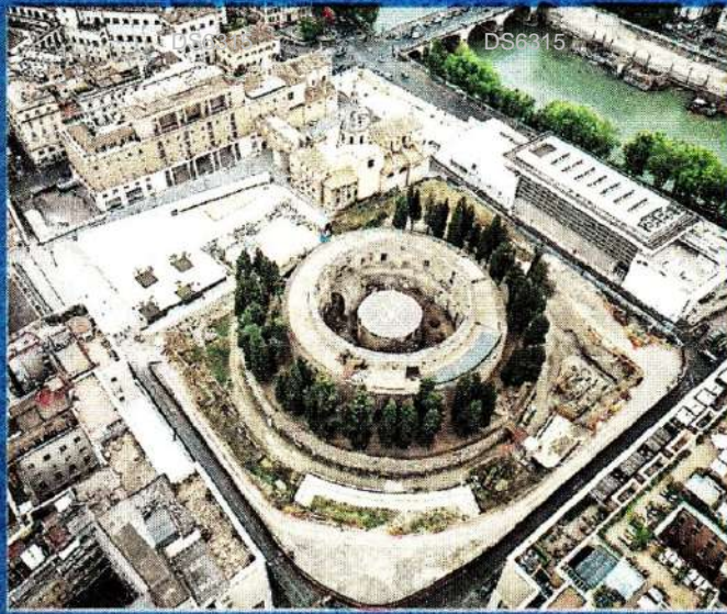
In alto una visuale panoramica dell'area appena inaugurata e sotto un dettaglio del nuovo look