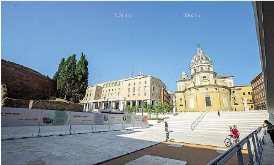
Rinnovata Piazza Augusto Imperatore è stata riaperta dopo anni di lavori (Foto nelle pagine a cura di Claudio Guaitoli)

ARTICOLO NON CEDIBILE AD ALTRI AD USO ESCLUSIVO DEL CLIENTE CHE LO RICEVE - DS6315 - S.27664 - L.1626 - T.1626