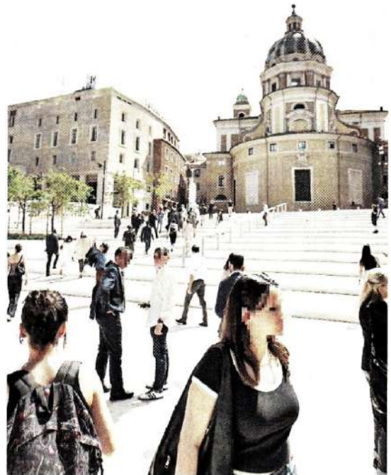
I romani riabbracciano piazza Augusto Imperatore A sinistra il sindaco Roberto Gualtieri all'inaugurazione