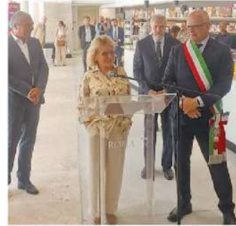
La presidente della Tim Alberta Figari e il sindaco di Roma Roberto Gualtieri

«Per Fondazione Tim contribuire al restauro è motivo di orgoglio perché restituiamo ai cittadini un luogo e un simbolo di Roma con l'impegno congiunto pubblico-privato», ha commentato Alberta Figari , Presidente della Fondazione e di Tim . «Investire nella cultura non è solo un gesto di responsabilità civile ma anche una scelta consapevole: significa generare valore per la collettività, rafforzare il senso di appartenenza e promuovere una visione condivisa del futuro. La Fondazione TIM finanzia progetti innovativi in ambito sociale, educativo e culturale, con l'obiettivo di rispondere ai bisogni reali di persone e territori. Con questo spirito abbiamo finanziato il recupero del Mausoleo: segno concreto della volontà di costruire ponti tra passato e futuro, generando un impatto positivo sulla società».