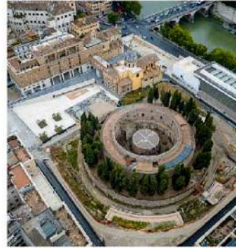
Mausoleo di Augusto Ripartiti i lavori di riqualificazione

••• Archiviato il taglio del nastro di piazza Augusto Imperatore sono ripartiti i lavori del restauro e della musealizzazione del Mausoleo, il più grande sepolcro circolare conosciuto del mondo antico. Intervento atteso da tempo - la conclusione della prima fase risale al 2019 - è ripartito con il bando pubblicato a dicembre 2023. Saranno realizzate opere di completamento e finitura degli ambienti interni e di restauro della cella funeraria. Verranno anche installati impianti elettrici e di illuminazione, di videosorveglianza e riscaldamento. Un nuovo percorso di visita sarà ricavato all'interno dell'area verde, i cui cipressi - ormai in cattive condizioni - saranno sostituiti con nuovi esemplari. Sarà inoltre aggiunto un collegamento pensile tra via dei Pontefici e la quota dell'ex cortile di Palazzo Correa. I lavori dureranno 18 mesi, per un importo di 7,19 milioni a cui la Fondazione Tim contribuisce con sei milioni, realizzando così il più importante impegno in ambito culturale dalla sua nascita.